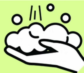
LAVADO DE MANOS